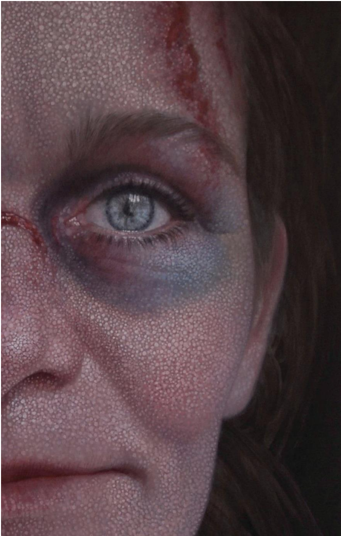
Resilience (veerkracht), detail. 2019, olie/doek, 80x100 cm

'Ik kan ontzettend eigenwijs zijn en in de kunst word je daarvoor beloond. Verder kan ik maken wat ik zelf heel graag wil hebben, dingen waarbij ik vroeger in musea stond te kwijlen. Ik vind het nog steeds heel bijzonder dat ik dat heb kunnen leren.'