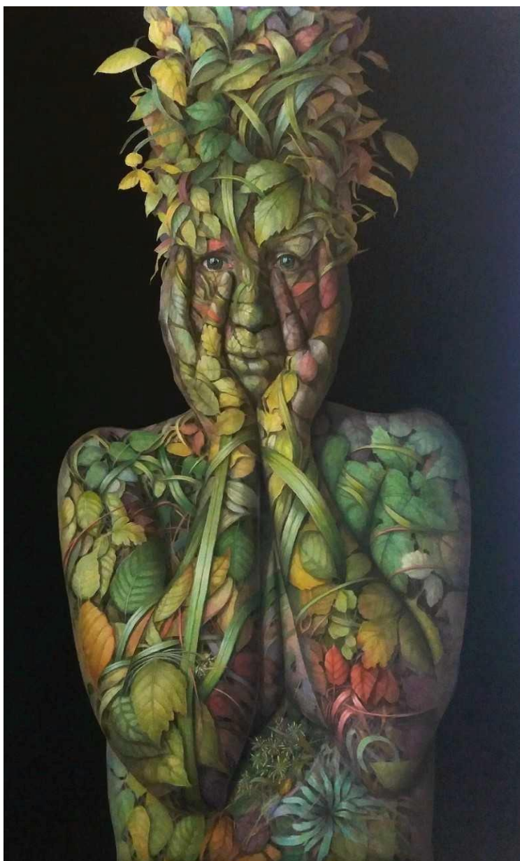
Cohesion (samenhang), 2019, olie/doek, 100x160 cm

In 2014 schilderde je Joop van den Ende voor het programma Sterren op het doek. Heeft deelname aan dat programma je nog wat opgeleverd?